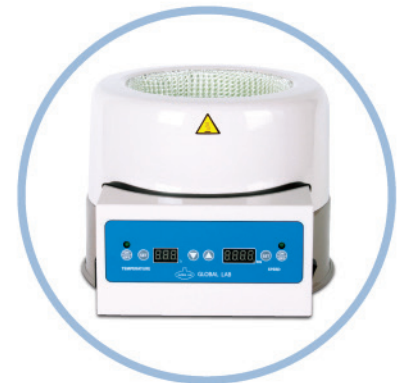
GLHMSD (2l ~5l )