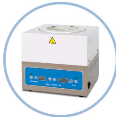
GLHMSD (100ml ~1l )