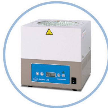
GLHMD (100ml ~1l )