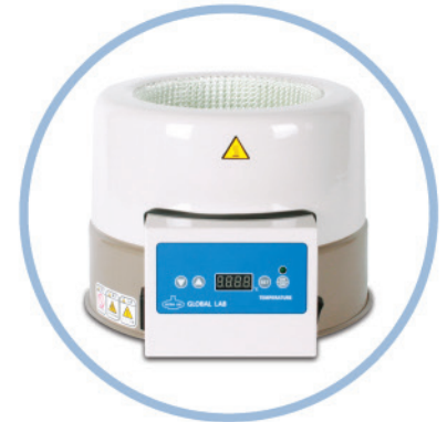
GLHMD (2l ~20l )